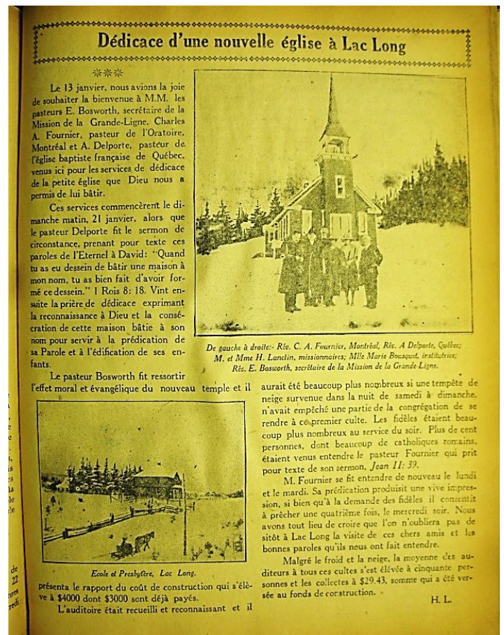
Extrait du journal L'Aurore , 9 février 1923

Pour le comité organisateur du 100 ème anniversaire de la Chapelle au Pied-du-Lac.