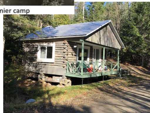
Camp en bois rond

Lors de leurs séjours, les membres et leurs invités devaient compléter la fiche intitulée Rapport du membre permettant aux administrateurs de faire un bilan assez juste des activités et de la récolte des poissons et du gibier. Il y aura toujours deux ou trois camps accessibles aux membres et aux invités (Le grand camp et le camp en bois rond) dont un satellite au lac du Père (grand lac English).