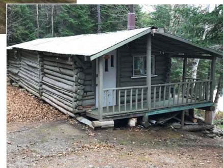
Camp du lac du Père