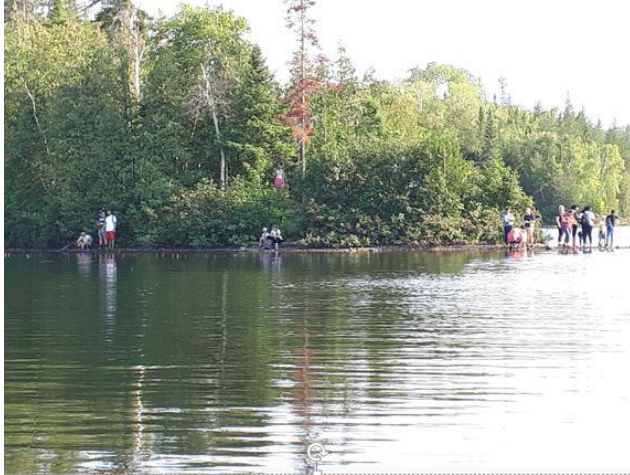
Visite de nouveaux arrivants au Témiscouata

En 2020 et 2021 à cause de la Covid nous avons cessé de tenir les statistiques d'utilisation du sentier. Cet été nous avons remis en place les feuilles d'inscription volontaire. Même si plusieurs personnes ne prennent pas la peine de compléter le document, d'autres s'inscrivent. Voici les données compilées : Entre le 3 juillet et le 23 octobre 2022 (110 jours) il y a eu 160 visites (lignes remplies) dont 45 sont de Rivière-Bleue pour un total de 450 personnes dont 93 provenant de Rivière-Bleue.