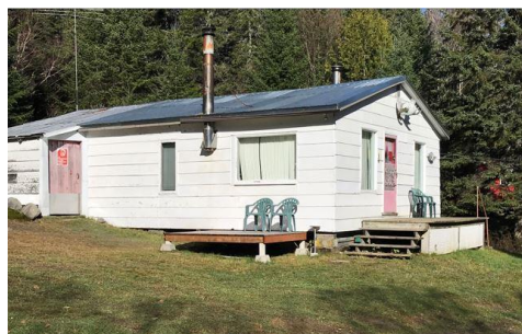
Le grand camp

Le Club De La Pointe Blanche va profiter de son droit exclusif de chasse et de pêche pendant une vingtaine d'années, soit jusqu'en 1977. Même sans droit exclusif, le Club va continuer ses activités. Les camps, rénovés bien sûr, sont toujours là. Deux de ces camps (camp en bois rond et camp du lac du Père) appartiennent maintenant à des propriétaires privés. Seul le grand camp demeure la propriété du Club. Des membres vont quitter, d'autres vont venir s'ajouter