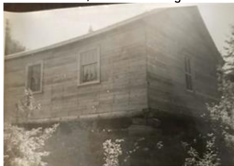
Le premier camp