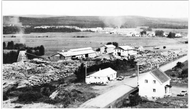
Les Cèdres de Rivière-Bleue

Un certain nombre d'employés feront le choix de suivre l'entreprise et quitteront Rivière-Bleue.