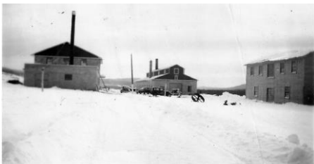
La B.C.L. en 1950. À gauche l'atelier de menuiserie, au centre la fonderie et à droite l'entrepôt

L'emplacement laissé vacant par le départ de la compagnie Durette et Guérette trouve rapidement une nouvelle vocation. «Le 8 mai 1947, La fonderie