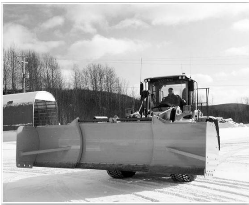
Une réalisation de l'entreprise, une gratte extensible

Au début, le travail consiste surtout en la réparation de machineries forestières, camions, remorques, avec quelques soudeuses, un petit atelier d'usinage et un employé. Maintenant, après de nombreux investissements l'entreprise possède une superficie de 16 700 pieds carrés de plancher.