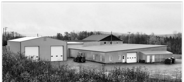
Atelier de l'entreprise ASN Machinerie, la partie foncée est la bâtisse originale