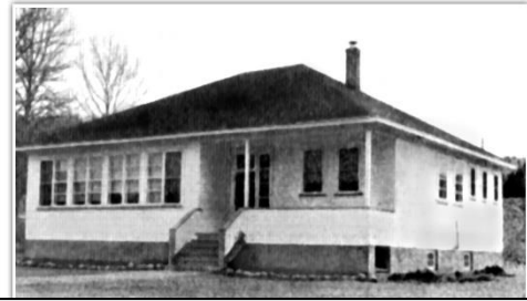
École catholique de Pied-du-Lac