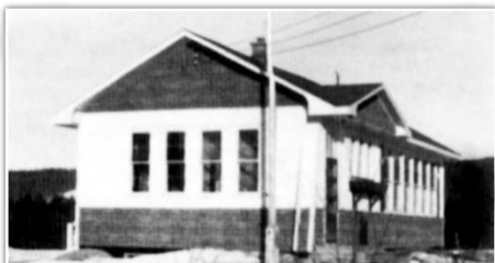
École protestante de Pied-du-Lac