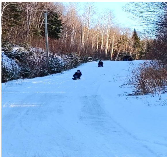
Légende photo : Ici, on glisse sur le sentier 3 Frontières!